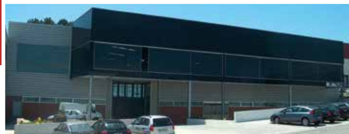
EDIFÍCIO INDUSTRIAL - MAIA - PORTUGAL Área de Cobertura 3 500m²

Execução e montagem de estruturas metálicas, revestimentos de coberturas e fachadas. Execution and assembly of steel structures and roofing and facade coatings. Exécution et montage de structures d'acier et de toiture et de façade revêtements.